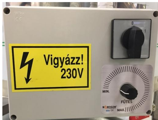
Bild 6. Heizungsregler

Wenn das Heizwasser die gewünschte Temperatur erreicht hat, stellen Sie die gewünschte Geschwindigkeit der Rührschaufel mit dem Geschwindigkeit-Drehknopf ein.