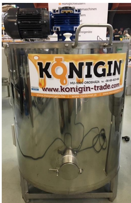
Bild 1. Honigrühr- und Mischgerät

Die Honigrühr- und Mischgeräte sind zur Herstellung von feincremigen Honig und zur Vermischung verschiedener Honigsorten geeignet. Wir produzieren zwei Grundmodelle: ohne und mit Beheizung.