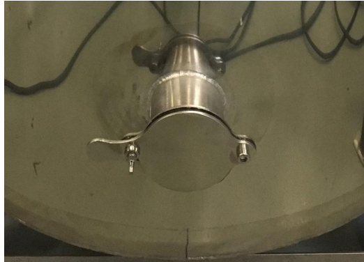
Bild 7. Auslasshahn für Honig

Zum Auslassen des Honigs wird ein Auslasshahn an dem unteren Teil des Behälters angebracht. Es ist zweckmäßig, die Heizung während des Auslassens nicht auszuschalten.